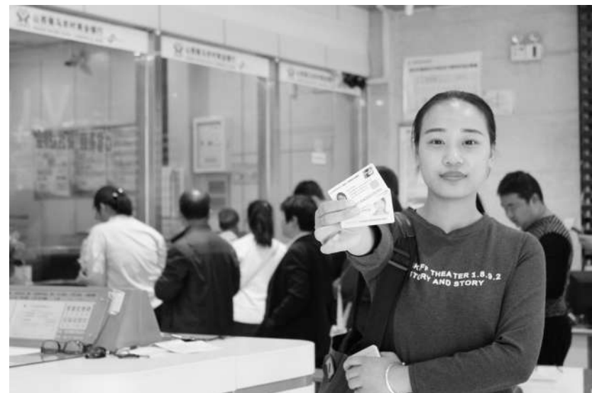
国庆假期刚结束,正值各项业务办理高峰期,尤其医保征缴、收费等工作客户扎堆办理,山西侯马农商银行开发区支行通过设置柜台弹性窗口,合理安排,开启“特事特办”通道,在大堂引导、柜员办理、后台参与的分流流程操作下,认真接待每一位客户,为他们提供更方便、快捷、准确的服务,提高工作效率的同时,赢得客户的一致信赖。图为业务办理现场。王榕