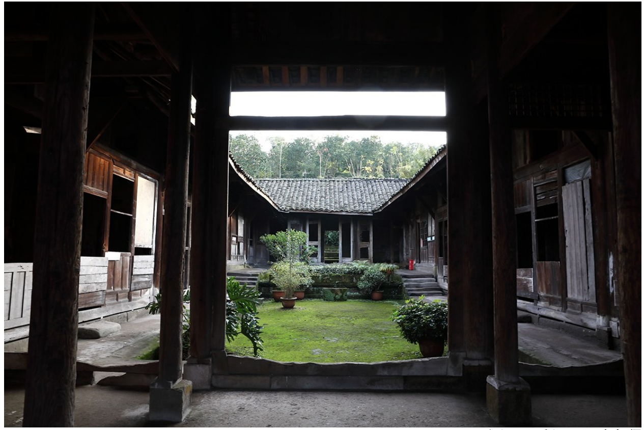
川西南古民居·雷物故居

父亲就如同一座屹立不倒的大山,默默地撑起了我们这个家。只愿岁月的脚步能慢点,再慢点,让我的目光驻足在父亲的每一个画面。