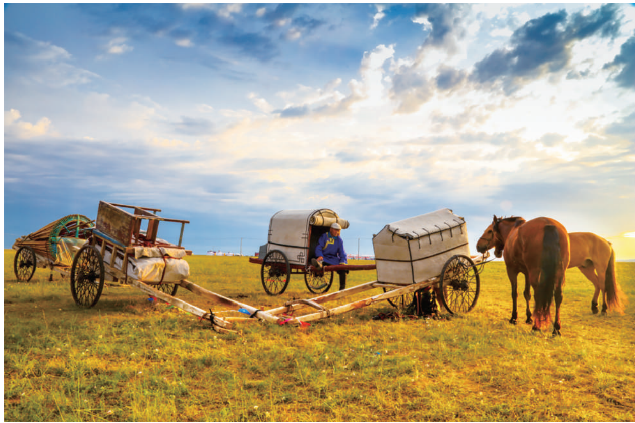
牧场秋景

爱秋,赏秋,赞秋。秋天是甘美的酒,秋天是瑰丽的诗,秋天是动人的歌,如果说日月轮回的四季是一幕跌宕起伏的戏剧,那么秋天就是戏剧的高潮。