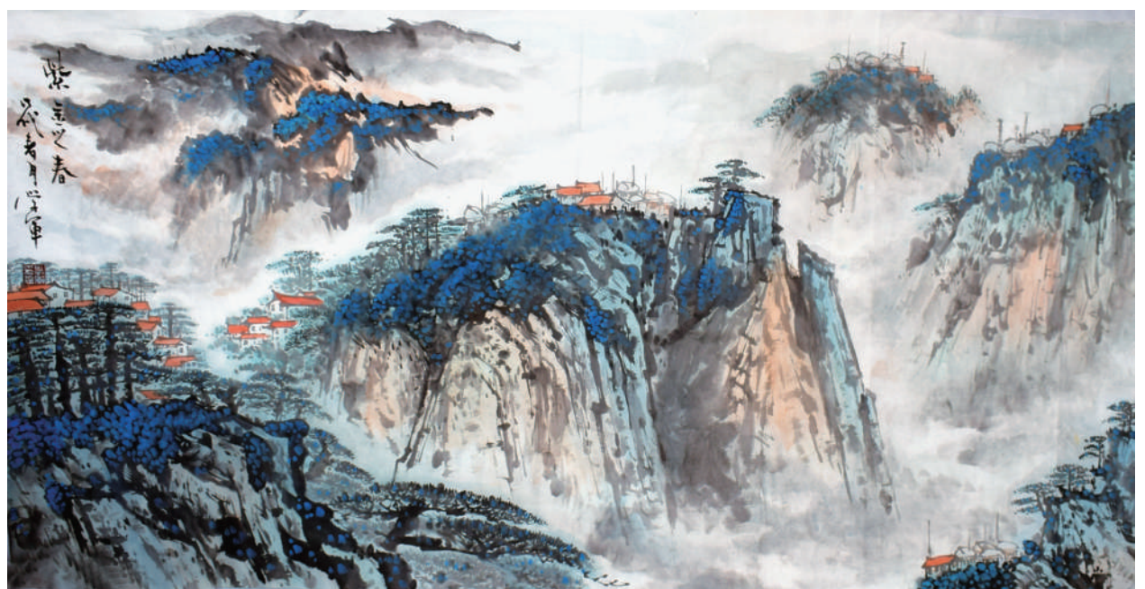
洞庭春色图 查雪军

在外工作便不声不响地种了两亩地的棉花,不卖,只为自家用。我能想象父亲是怎样精心地侍候这几亩棉花。育种、锄草、施肥、管理、打药一系列的活儿我没看到,看到的是刚刚晒出来饱含父母满满爱意的新棉被。那一晚,我把脸埋进棉被里,心一下子掏空了,眼泪不争气的涌了出来。整个冬天,对我而言,父母的爱,就像这棉被一样,温暖、踏实,无可取代。 许多年以后,我依然清晰地记着父亲临终时的叹息:“如果可以,我真想下辈子再做你们父亲,真想把你们一一扶上马再送一程,但今后的路要靠你们自己了。”这世上,还有谁,能让我如此安心地被牵着放手前行?还有谁,能让我在迷茫无助的时候全力依靠?是父亲,是父亲含蓄深邃的爱,勤劳宽厚的品质,一直在激励我,鞭策我。让我在不断的学习汲取中提升自我,完善自我,引导我从一个懵懂幼稚的青葱学员成长为成熟干练的业务能手;让我在现实社会,还能守望自己的心灵花园,找寻到人生的航标,迎来了今天对家庭事业的坚定与坚持;让我在繁忙的工作之余,辟一块安静的绿地,不以物喜,不以己悲,在生活中开出了绚丽芬芳的花朵。 光阴荏苒,岁月无痕,父亲离开我已经十多年了,思念在时光流逝中悄然滋生,久久发酵。没有父亲的日子,留下令人惶恐的虚空,只能用回忆来拼命填充。父爱如山,静默无语,母爱绵长,润物无声。我那至亲至爱的父母,是我飘零在外时可为笃定归依的所在,是我心所皈依的永恒避风港,它让我一直铭记父母的叮嘱,心存善念,脚踏实地,勇往直前。