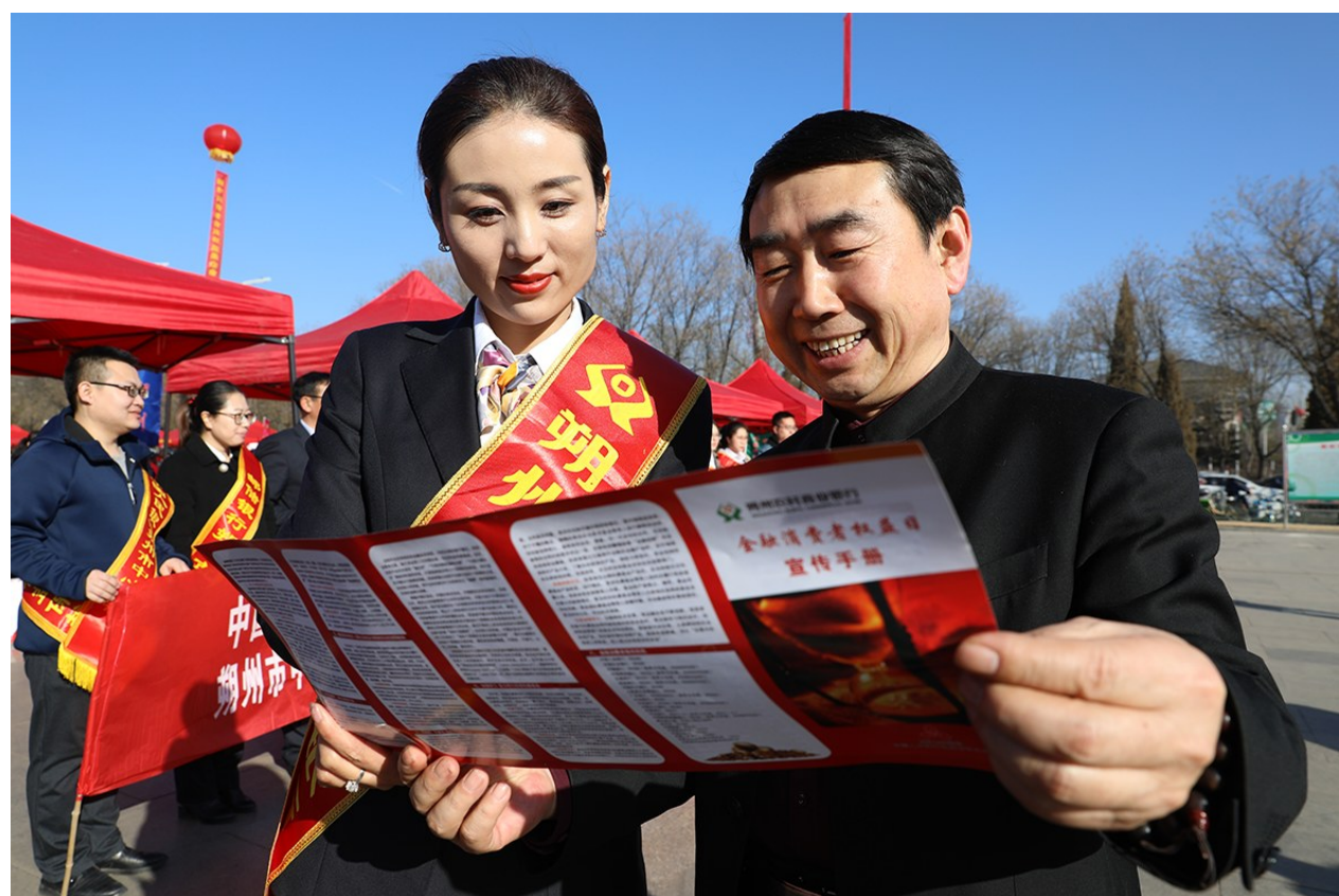
为扎实做好“3·15”消费者权益保护教育宣传周活动,近日,山西朔州农商银行早安排、早部署、早行动,突出“以消费者为中心优化服务”活动主题,不断提升服务意识,改善服务质量,创新服务形式,展现了朔州农商银行良好的服务形象。图为该行工作人员向群众介绍金融知识。李晟华

在涉农产业选择方面,中宁农商银行主动对接基层政府及“农口”部门,及时了解产业结构及政府主导方向,随时跟进当地农业工作重心,做好春耕生产资料、购买农业机具、支持返乡农民创业就业、农田水利建设、土地流转、规模种植等重点领域信贷项目的衔接和储备,为开展金融精准扶贫工作打下坚实基础。王永刚