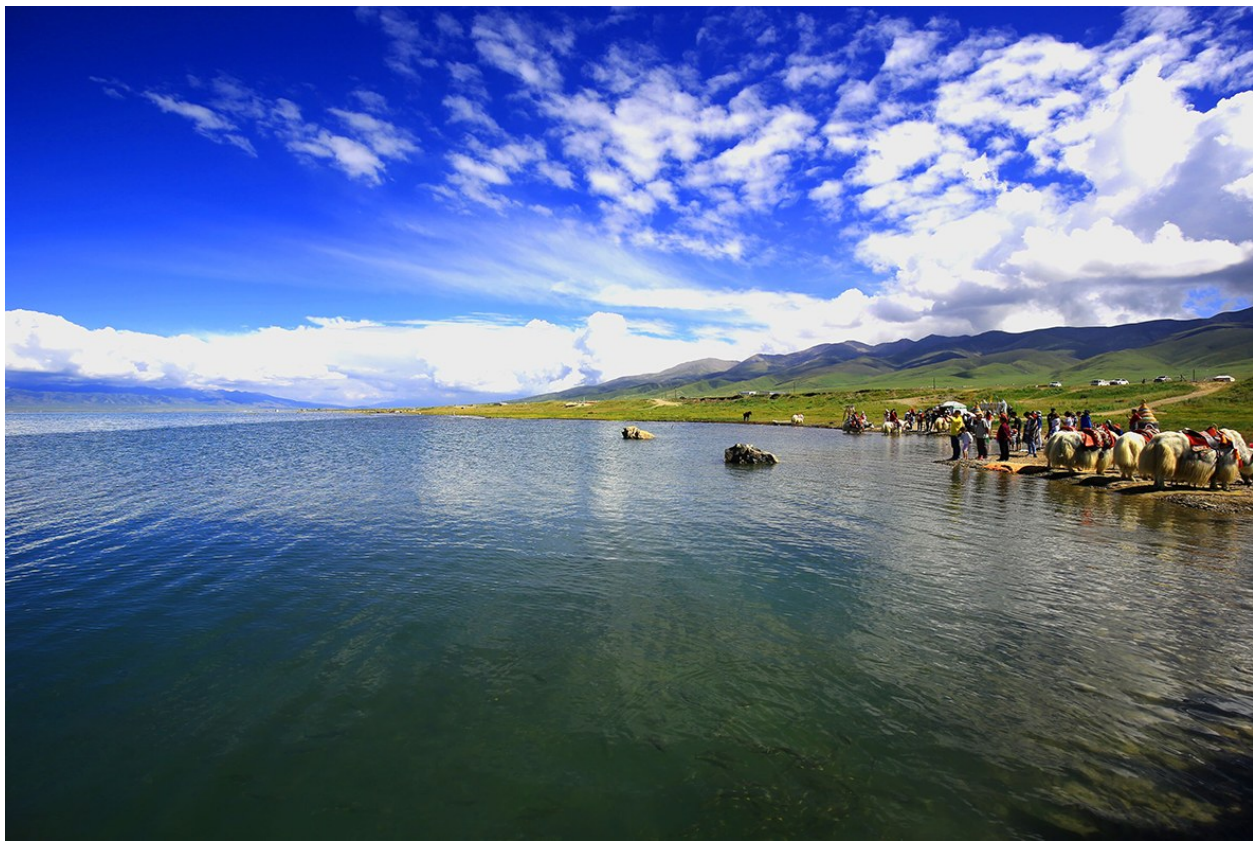
高原湖泊 顾尹鑫 (作者单位:江苏南通农商银行)

我小时候跟随外婆在镇上上幼儿园、小学，读初中、高中，父母则辗转乡村，经营百货店。读初一之前，每逢周六，父亲便骑一辆永久自行车穿过乡间小路，来镇上接我回家；周一早晨，再载着我，经过园艺队，送到老街上学。坐在自行车后座上，依靠在父亲宽阔的后背上，饱览水芹田的风光。秋天，水田倒影着天光云影，探出水面簇生的芹叶如毯，厚敦敦、绿滴滴、油亮亮；冬天，水面笼起袅袅雾气或者结