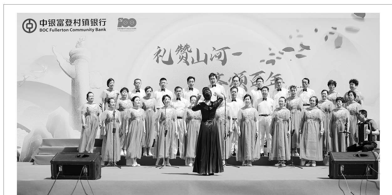
近日,“礼赞山河 齐颂百年——为建党100周年献礼”中银富登杯全辖合唱大赛圆满落幕。来自山东邹城、江西宜丰、陕西兴平等地区的15支参赛队伍角逐决赛奖项。

村镇银行主发起行——温州龙湾农商银行2021年所开展的“青年铁军培养计划”就采用了这些标准。二是村镇银行的党员干部要发挥好先锋模范作用,在乡村振兴、脱贫攻坚、公益活动等方面率先垂范,走在前列,干在实处,从而提升村镇银行党组织的公信力和影响力。三是村镇银行党建活动要覆盖全员,全体员工都应该上党课,特别要让年轻员工了解党史、感受党恩,激发党性、入党的积极性。今年6月19日,上海浦东恒通村镇银行利用“五周年”契机,用党建引领团建活动,全行参观嘉兴南湖革命纪念馆,学党史、悟思想。四是村镇银行党组织要号召全员积极参与公益事业和志愿者活动,党支部可以和属地政府或公益组织联盟,号召党员干部在脱贫攻坚、防电信诈骗、防范疫情等工作上主动讲奉献、显担当。(作者系上海浦东恒通村镇银行副行长)