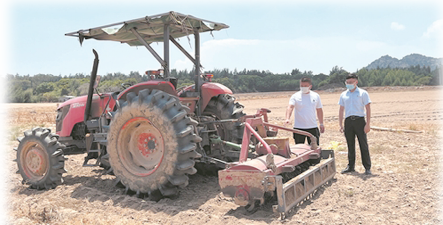
建设银行石狮分行工作人员正在申请“善担贷”的石狮县一家福建省省级示范家庭农场,了解农场秋耕动向。

今年以来,建设银行石狮分行积极探索乡村振兴建设路径,立足福建石狮县域,践行“新金融”理念,运用新思维、新方法,深耕三农,构建“乡村振兴+”多元生态,释放县域发展新动能,努力用“新金融”实践为乡村振兴贡献建设银行智慧与经验。