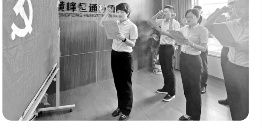
近日,江西横峰恒通村镇银行开展以“不忘来时路,奋进新征程”为主题的党日活动,活动形式丰富多元化,召开“感悟七一建党精神”党员会议,开展创建文明城市、共建美好家园志愿服务,开展安全教育宣传等活动,下一步,该行将在健康发展的同时继续履行好社会责任。图为全体党员在党支部书记的带领下进行集体宣誓。 吴雅娟