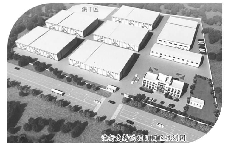
该行支持的项目园区规划图

农发行山东省无棣县支行坚持履行为民,大力推动县域内粮食仓储、服务国家粮食安全,成功获批仓储设施贷款1.45亿元,用于支持无棣县智慧粮库、应急保障物资储备库及粮食加工建设项目。