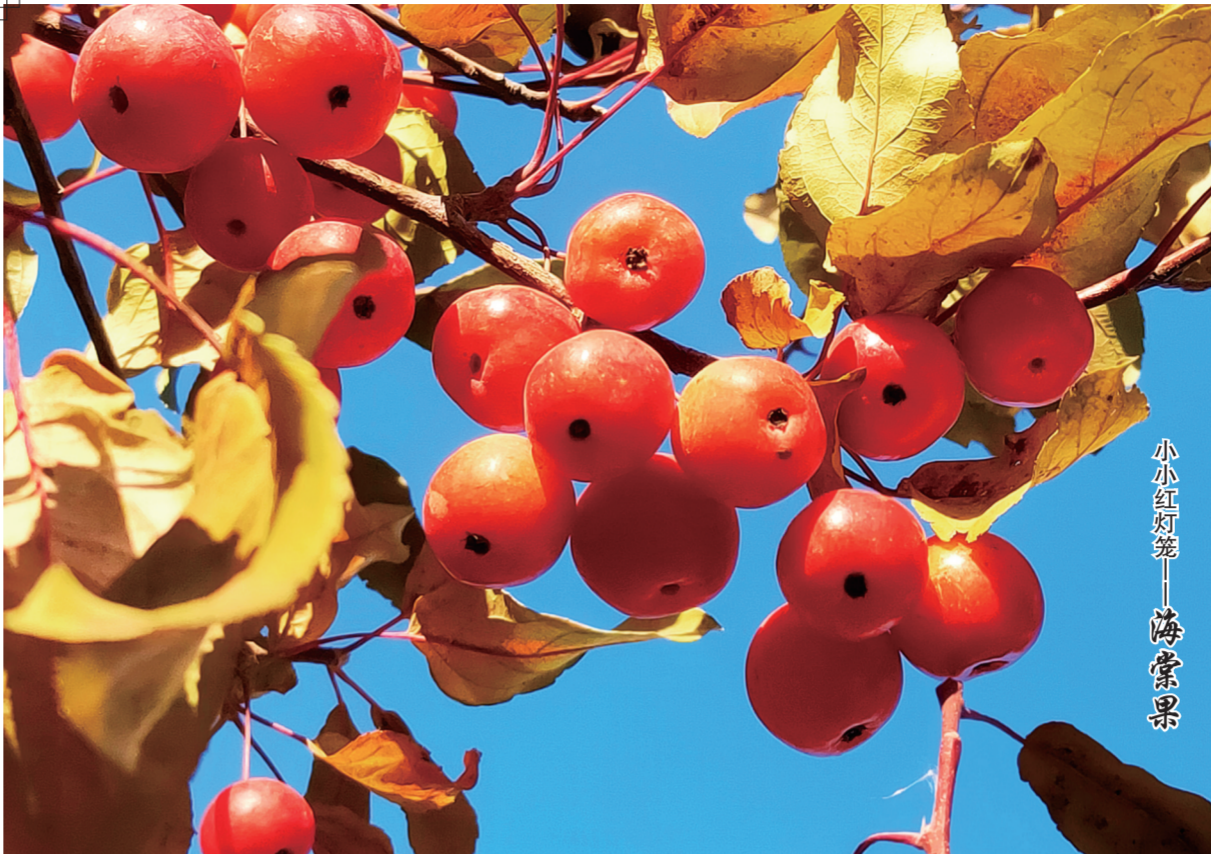
小小红灯笼——海棠果