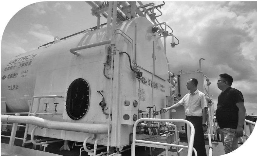
该行领导实地调研改造情况

该笔贷款的成功投放,一方面解决了中小微企业融资贵、融资难的问题,填补了当地船舶行业改造升级之