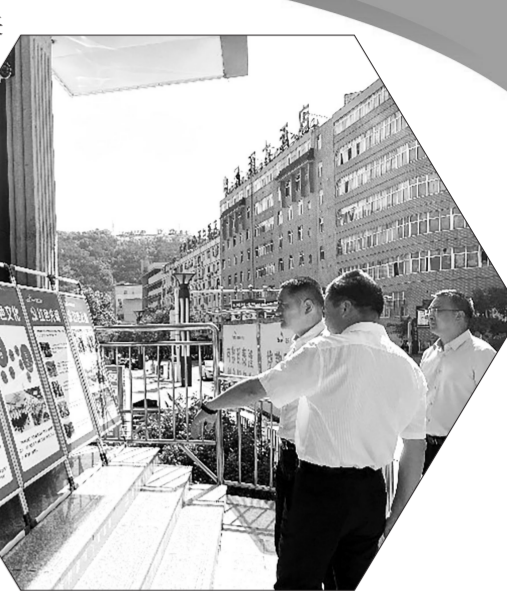
该行工作成果展示

该行积极投身公益事业,今年3月,该行联合浙江泰隆慈善基金会为旬阳市城关实验学校捐资5万元,共建“爱心图书室”;今年6月,该行组织员工深入田间地头,依托网络公益助农助销平台,为农户解决枇杷滞销难题。自成立以来,该行始终坚持“以