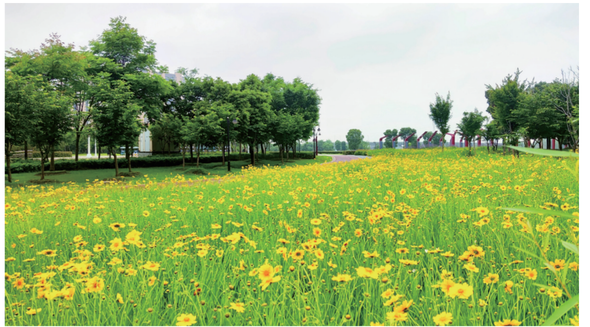
美丽乡村 向阳而生

“个人梦”连着农商梦，农商梦连着中国梦。作为新时代的农商人，如何将“农”字文章写得如诗如画，将“商”字理念发挥得淋漓尽致，将“人”字情怀表现得感天动地，我们责无旁贷。我们要不忘初心，抓铁有痕、踏石留印，用汗水、用智慧助圆百姓致富梦，用心耕耘农商梦，共建和谐幸福的中国梦！ （作者单位：江西泰和农商银行）