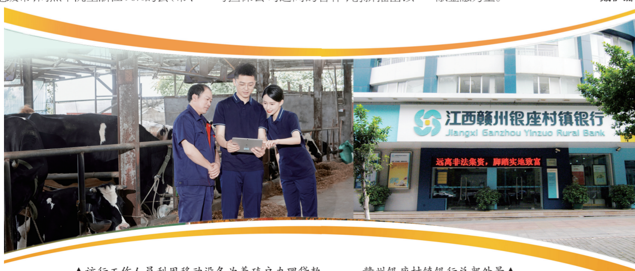
▲该行工作人员利用移动设备为养殖户办理贷款