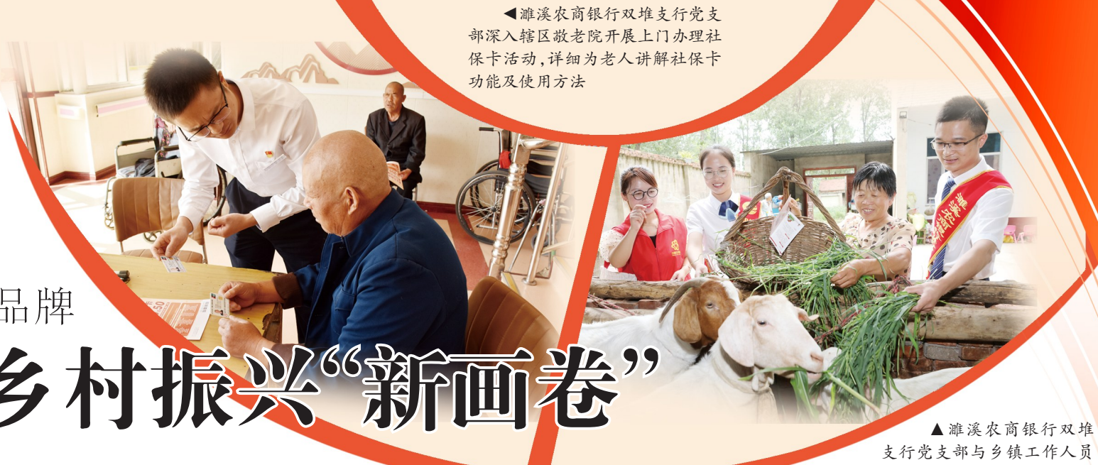
▲濉溪农商银行双堆支行党支部与乡镇工作人员一起走访村户种植养殖户,了解其资金需求,为其纾困解难

建设有限公司是开发区支行党支部结对共建企业之一。前不久,开发区支行为其发放“中信贷”500万元,助力其发展壮大。