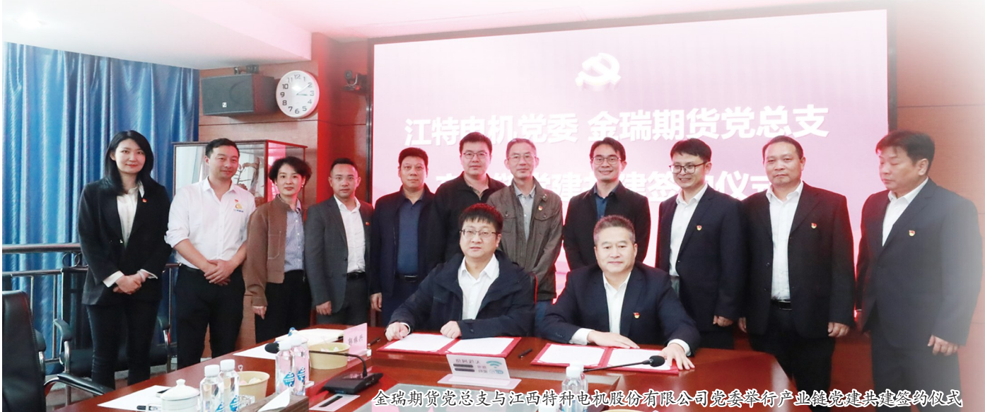
金瑞期货党总支与江西特种电机股份有限公司党委举行产业党建共建签约仪式