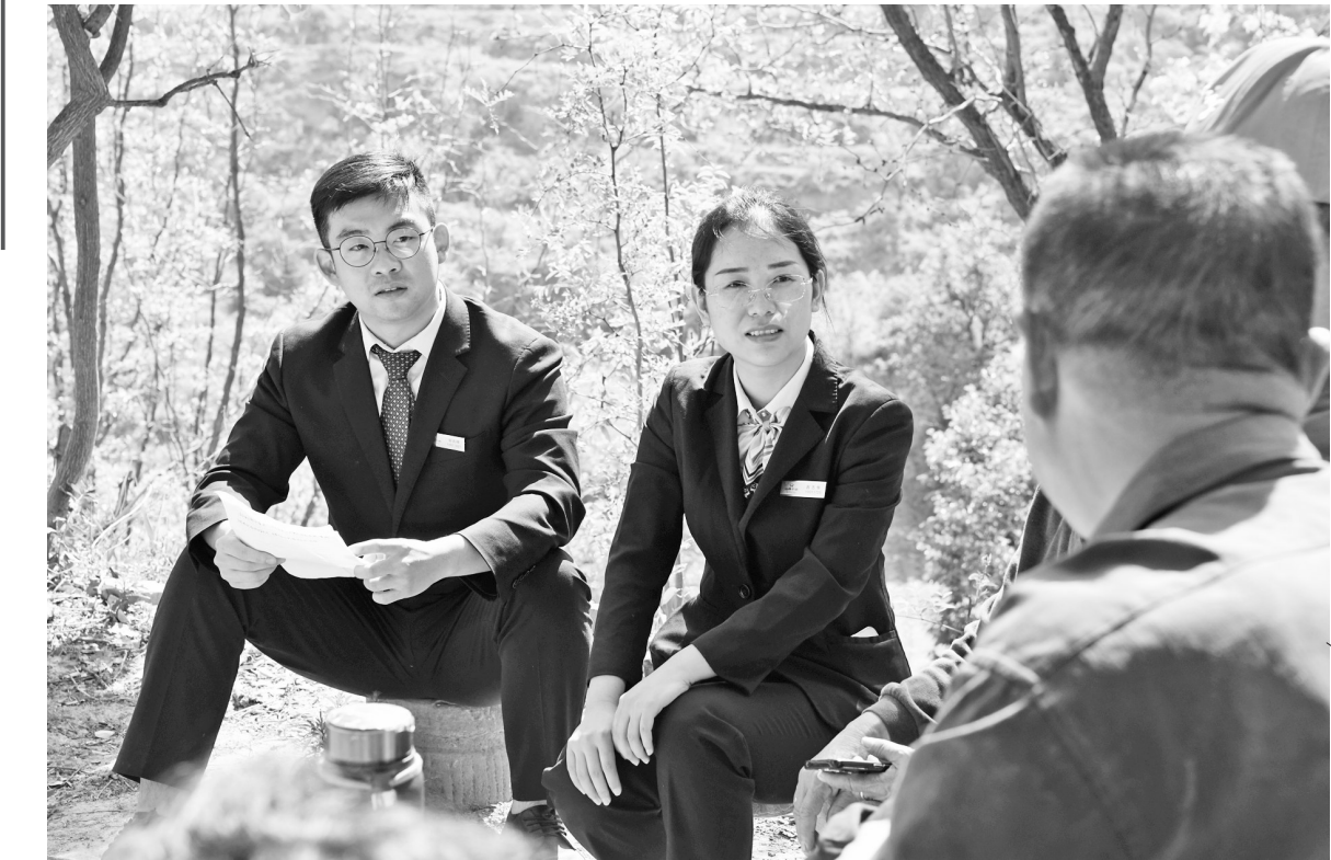
山西尧都农商银行立足地方,始终坚持支农支小定位,围绕辖内农业发展的新变化、新需求,主动下沉、访困问难,不断创新信贷服务的渠道和方式,着力为实体经济发展注入金融新活力。图为该行工作人员深入群众家中了解其金融需求。 康建军

过程中的融资堵点。 吉安辖区农商银行深度融入当地政府“十大攻坚战”,有力推进巩固拓展脱贫攻坚成果同乡村振兴有效衔接,为油茶产业高质量发展提供源源不断的金融“活水”。该辖区农商银行大力配合地方政府扶持行业龙头企业上市计划,对有意愿上市的龙头企业提供超过5000万元的信贷支持。与此同时,吉安辖区农商银行不断增强面向油茶产业的“保链强链”融资服务,对4家品牌企业、深加工企业发放贷款3200万元,为符合授信条件的油茶种植大户、油茶合作社和小型加工企业提供了4000余万元信贷授信,引导企业由小作坊向精深加工的现代化农业企业升级改造,由成品油加工销售向附加值产品研发转型,由传统营销向做品牌、做特色升级,助力企业做响“五百里井冈”等多个省内著名茶油品牌,为吉安打造赣江中游生态经济带和“两山”转化示范区作出农商贡献。 唐丽果