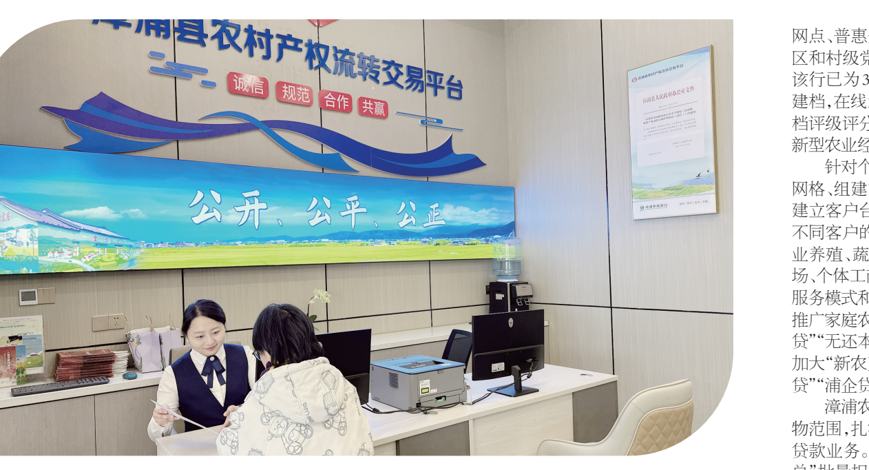
▲漳浦农商银行客户经理在“一站式”综合网点为客户提供农村产权流转交易服务

“深耕基层,厚植‘三农’”是福建漳浦农商银行的情怀与使命。借助于数字金融,漳浦农商银行走出了一条农商银行特色化转型发展之路。 漳浦县乡村振兴局联合推出“百名金融指导员驻村”活动,该行选派105名干部和业务骨干担任县、乡镇、村的“乡村振兴金融指导员”,以村干为“媒介”,开展“走千家企业、访万户客户”活动;通过创新“党建+金融+乡村振兴”联动方式,与县属300多个党组织、企事业单位建立了战略合作关系,以福建农信“党建+金融助联”“增信+担保”组合拳,做到“见贷即保、批量担保”,有效破解了农村区域种植养殖大户和存量优质客户增信担保的问题。面对个体工商户、小摊主的支付结算需求,该行采取“7×24小时”服务模式,为客户提供业务咨询、“聚合支付”、社保+服务和“商e付”“漳浦快贷”等金融服务。 工作中,漳浦农商银行推出“金融+产业带头人+产业”服务模式,为坂坂村360户农户提供了支持,有效推动坂坂村及产业集聚效应形成;同时,该行加快数