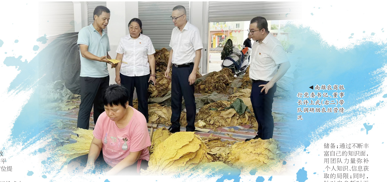
▲南雄农商银行金叶贷(金米贷)客户经理深入田间地头为农户提供金融服务

钩,而且还关系到土地流转后农民的利益。黄烟种植前期投入较大,一亩地先期需要投入4000元左右。如遇火灾或当年雨水较大,极易造成黄烟大面积减产或烟叶品质受损。为此,南雄农商银行主动和烟草公司开展党建共建,收集烟草种植经验及受灾年份烟农收入、种植投入等“小数据”,推出“金叶贷”产品,累计向近1000多个黄烟种植大户发放贷款2623笔、金额2.78亿元,保障了黄烟种植产业的良性发展。 被誉为“粤北粮仓”的南雄市,汇集了众多米业小微企业和个体工商户。南雄农商银行利用大数据产业链上下游数据,在缺少抵押物的情况下,派出“金融辅导员”为小微企业定制金融服务方案,利用“金米贷”和组合贷款等方式,为米业小微企业和个体工商户发放贷款176笔、金额3.38亿元,帮助企业缓解融资难、融资贵问题。 南雄农商银行积极与南雄市人社局等机构建设信息共享平台。在南雄市,只要资金用途合理,有劳动技能,不良嗜好的人群均能在南雄农商银行获得金融支持。经营主体如因受灾或市场环境造成还贷困难,南雄农商银行将主动帮助其进行财务规划,支持其再生产。为了满足不同客户的生产需要,该行还开发了“薪金贷”“村致富贷”“绿美林权贷”等一系列特色产品,并根据客户对姓氏文化内涵的认同和共同“小数据”,成功推出深受客户喜欢的、具有姓氏文化内涵的“姓氏富民卡”;通过文化拉近了与客户的关系,促进了业务发展,截至2024年6月末,南雄农商银行签约手机银行客户超7万户,发生交易近100万笔。 近年来,南雄农商银行在“小数据”的加持下,持续深耕市场,挖掘客户,已形成了“一人一网格,一格一区域”的网格化金融服务