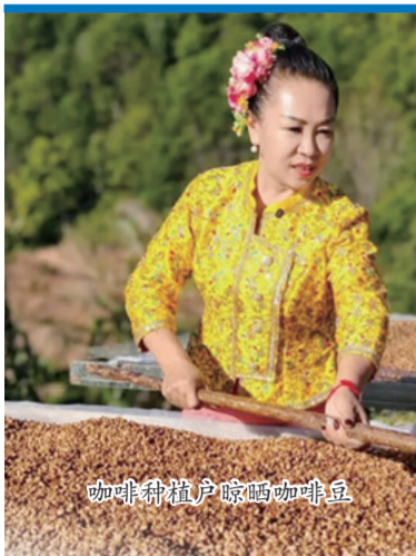
咖啡种植户晾晒咖啡豆

初夏的普洱，群山被绿，层层叠叠的咖啡林如绿色海浪翻涌，星星点点的白色咖啡花掩映其间。地处北回归线穿过的世界咖啡种植“黄金地带”，云南省普洱市以73.4万亩种植面积孕育27万咖农的致富梦想，构筑起中国最大的咖啡种植地与贸易集散地。这颗小小的“黑金”，既是远销海外的名片，更是无数咖农安身立命的底气。为持续夯实这份底气，富滇银行普洱分行主动融入“咖旅融合”发展战略，紧扣“深耕产业链，聚合生命力”的工作思路，创新打造云南省首家“咖啡主题银行”。