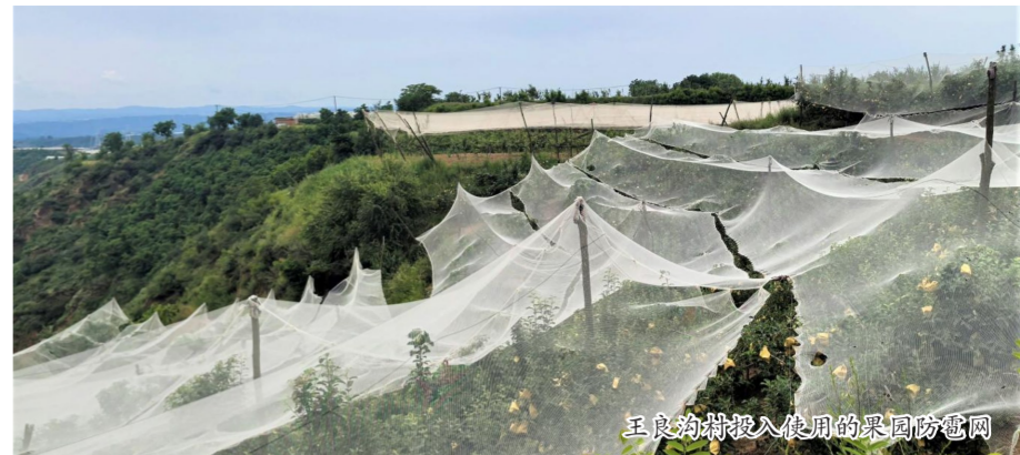
王良沟村投入使用的果园防雹网

大商所相关业务负责人表示,下一步,大商所将立足实体经济,坚持“一品一策”,不断优化完善期权合约规则,深化期货市场培育力度,持续提升棕榈油期权的功能发挥水平以及产业认知度和参与度,更好地服务油脂行业稳健经营和高质量发展。